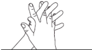
3 Doigts entrelacés Désinfection des espaces interdigitaux et des doigts