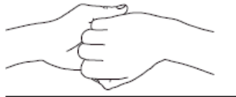
4 Paume/doigts Désinfection des doigts