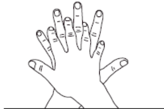
2 Paume sur dos Désinfection des doigts et des espaces interdigitaux