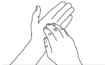
6 Ongles Désinfection des ongles