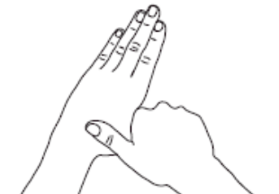
5 Ponces Désinfection des ponces