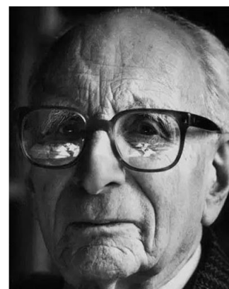
Claude Lévi-Strauss (1908-2009)

pour dire « cru » puisque le concept même ne peut en être caractérisé. Partant de ce constat, et du mythe du dénicheur d'oiseaux, il tente de montrer comment l'ensemble des mythes amérindiens forment un système cohérent . Surtout, il met en lumière la fabrique du réel, soulignant combien celui-ci est conditionné par l'expérience : dans cet ouvrage fondamental Lévi-Strauss ne tente pas seulement de montrer comment les qualités purement sensibles et empiriques comme le cru ou le cuit se laissent articuler en un réseau abstrait de relations, souvent binaires (par doublets), et finissent par former un système. Il avance que seules des expériences nouvelles permettent de développer de nouveaux paradigmes.