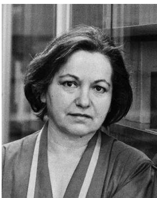
Françoise Héritier (1933-2017)

Pour exprimer le rapport orienté et hiérarchique entre les sexes, Françoise Héritier parle de la "valence différentielle des sexes". Ce rapport, profondément inscrit dans la structure sociale, a été construit sur la première différence observable, celle du corps des hommes et des femmes. Il s'ensuit que toute pensée de la différence est aussi une classification par doublets, comme on peut le voir dans les catégories cognitives : haut/bas, chaud/froid, sain/malsain, etc. C'est ainsi qu'hommes et femmes partagent des catégories "orientées" pour penser le monde. Or les valeurs masculines sont valorisées et les féminines dévalorisées. Ainsi en Europe, la passivité, assimilée à de la faiblesse, serait féminine tandis que l'activité, associée à la maîtrise du monde, serait masculine. Selon Françoise Héritier, ce rapport émanerait de la volonté de contrôle de la reproduction de la part des hommes, qui ne peuvent pas faire eux-mêmes leurs fils. Selon Françoise Héritier, la femme n'est pas biologiquement plus faible que l'homme. En fait, le développement physique des hommes aurait été culturellement favorisé.