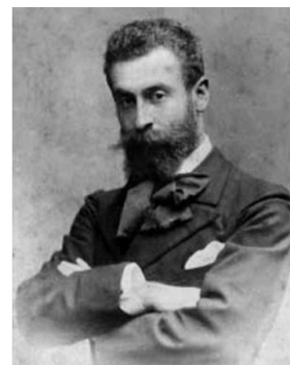
Marcel Mauss (1872 - 1950)